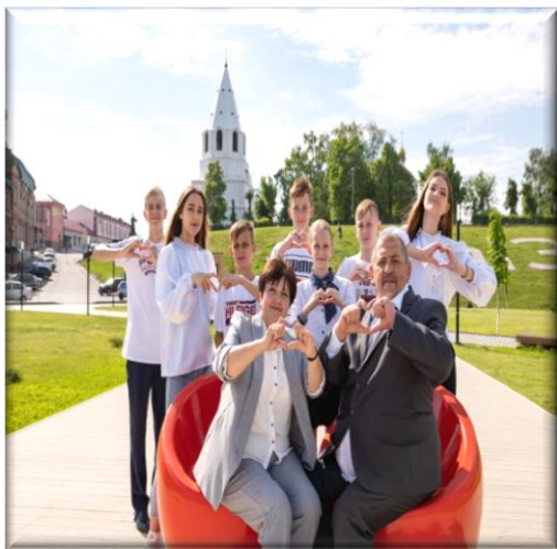
приемные семьи для пожилых и для детей сирот