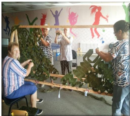
плетение маскировочных сетей