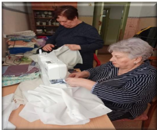
Пошив белья Плетение маскировочных сетей