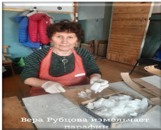
Изготовление блиндажных свечей Вязание носков для солдат в зоне СВО