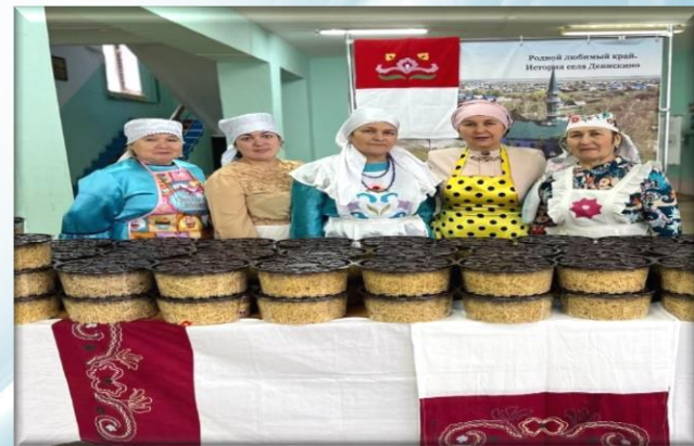
Партия домашней лапши Сбор и отправка гуманитарной помощи