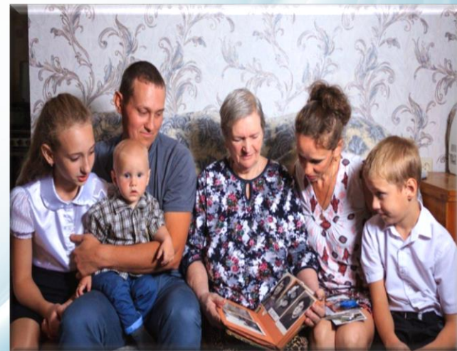
социальные контракты для малоимущих семей