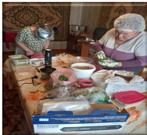
изготовление сухих супов, вязание носков для солдат в зоне СВО