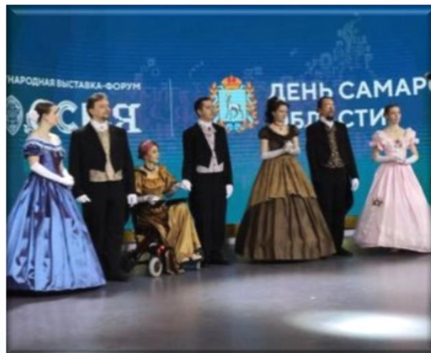
проект «Инклюзивные балы»