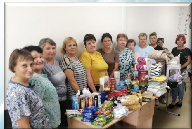
сбор и отправка гуманитарной помощи